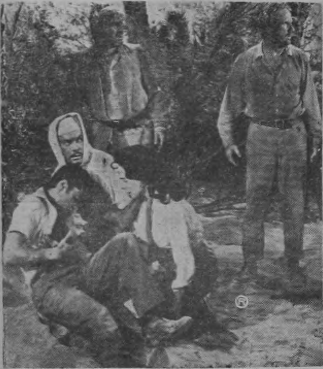
Una importante escena del film "Los Fugitivos de Sahrain", con Yul Brynner, el joven Sal Mineo —en el papel del estudiante que sigue a Yul— Madlyn Rhue —como enfermera árabe— y Jack Warden, en el rol de un estafador norteamericano.

Para millones de fanáticos del cine, Yul Brynner resulta un enigma: en la pantalla, una personalidad fascinadora; un desconocido; y en la vida real un personaje casi misterioso. Sin embargo, para miles de niños que jamás han visto una película, Brynner es un individuo genial y generoso que los hace reír y olvidar sus problemas. Y esos niños tienen muy serios problemas porque son niños refugiados.