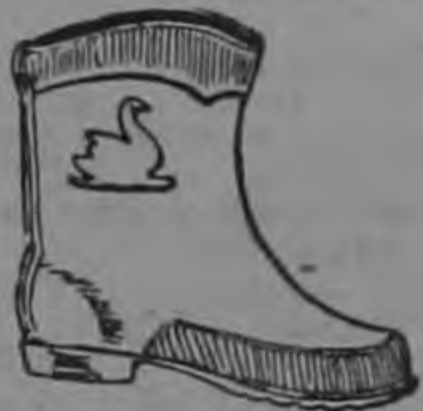
PATITO ₡ 10.00

los capitanes impetuosos y de las camarillas de turno, trabaja más fácilmente y logra sus fines sin reacción colérica alguna. El pueblo es allí el invitado de piedra a cuya espalda se teje despreocupadamente la urdimbre de la farsa redentora. En el caso de Guatemala se ha hecho —valga el ejemplo— gran hincapié en que todo ocurrió "incurientemente". Menos mal, es cierto; pero ello sólo demuestra cuán indiferente a la maniobra esperada fue el hombre-medio, el ciudadano-célula. Cansado de saberse gobernado por un incapaz, poco le importaba su derrocamiento. Sin embargo, luego vendrán las duras, y cuando el "salvador" logre la plenitud totalitaria del empeño y ya sea tarde para la protesta, el ignora. do comprenderá el error de su pasividad inconsciente. Por lo pronto, todo es expectativa y aun esperanza.