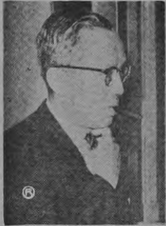
U THANT ...el problema de los soviéticos y la ONU...

mo un reto directo a la posición de los Estados Unidos en el sentido de que los países que se retrasen más de dos años en sus obligaciones financieras deben ser privados de su voto en la asamblea, tal como lo estipula la Carta de las Naciones Unidas.