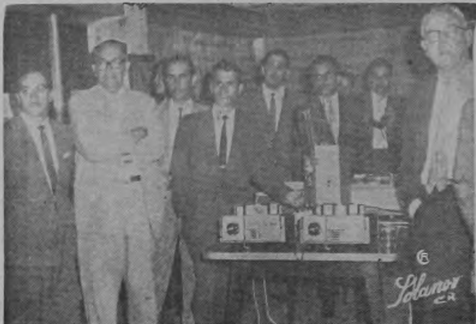
GRUPO DE ASISTENTES. En la gráfica parte de los asistentes a la importante exposición que hizo la I.F.S.A. sobre nuevos sistemas en los equipos Kodak.

Invitados por Importadora Fotográfica, S. A. (IFSA), Distribuidores Generales para Costa Rica de la casa Kodak, tuvimos el placer de asistir a un simpático acto en el Costa Tennis Club. Allí, siguiendo un plan de alcance mundial, se anunció a la prensa costarricense y a los Distribuidores Kodak de todo el país, un nuevo y extraordinario sistema de fotografía, por medio del cual resulta tan fácil cargar la cámara como colocar un bombillo en el portaflash. Segundos es todo lo que tarda uno en cargar, correr la película al primer cuadro, apuntar y oprimir el botón con cualquier una de las 5 nuevas cámaras KODAK INSTAMATIC anunciadas en la tarde de ayer. El tamaño de las mismas es más o menos el de un radio de transistores de los más pequeños y caben cómodamente en el bolsillo del saco, o en un bolso de mano. La clave del nuevo sistema de fotografía es el compacto cargador de película KODAPAK, el cual simplemente se coloca dentro de la cámara, pudiéndose retirar de ella con la misma facilidad una vez hechas todas las exposiciones. Como los cargadores KODAPAK son a prueba