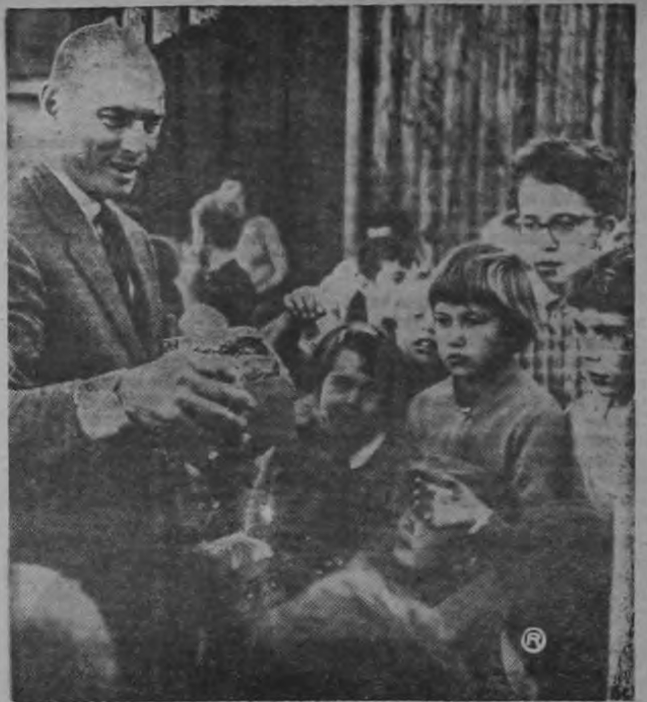
Como Consejero especial del Alto Comisionado para Refugiados de las Naciones Unidas, Yul Brynner distribuye dulces entre los niños del Campamento Luddwigsburg, en Alemania, durante el rodaje del documental de media hora de duración "Mission to No Man's Land". En este film Brynner presenta un dramático informe sobre el problema que confrontan 100.000 refugiados indefensos en Europa, indicando las medidas prácticas que podrían resolver su situación.

Y, a propósito, la más reciente película de Yul Brynner para la Paramount, es un intenso drama de aventuras titulado "Los Fugitivos de Sahrain". Su trama se desarrolla en la moderna Arabia. En este film Brynner encarna el papel de líder nacionalista, condenado a muerte por