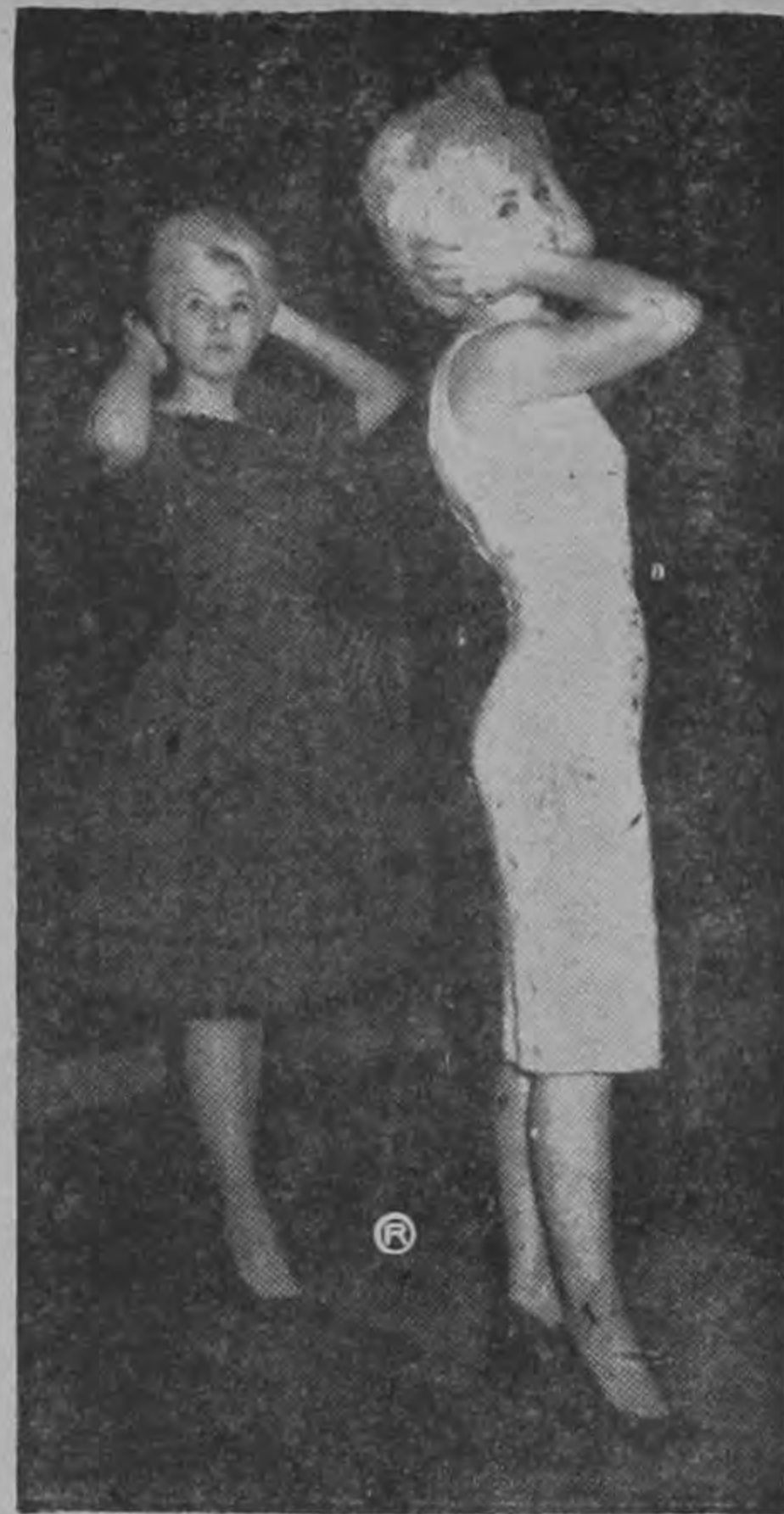
Gi-Gi y Lory en un llamado a nuestro fotógrafo son captadas cuando se arreglaban el cabello para continuar el ensayo.

Felices de estar en Costa Rica... no quieren irse.